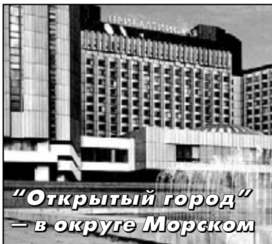
"Открытый город" — в округе Морском

Итоги первого тура выборов серьезно откорректировали позицию Муниципального Совета в вопросе информирования жителей округа о его деятельности. До этого, на протяжении двух лет работы, мы делали ставку на максимально возможное получение информации об округе и его жителях. Этой цели служили постоянные контакты с различными службами территориального управления района, ежедневная работа приемной Совета, встречи депутатов с жителями округа, руководителями предприятий и организаций, работающих на его территории.