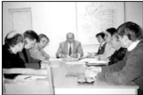
Окончание. Начало на стр. 1