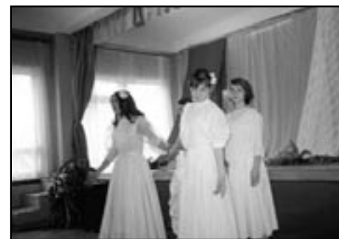
ных с оказанием социальной помощи?

Есть и такие обращения. В основном, от людей пожилых и одиноких, с небольшими пенсиями. Хотя нелегко сейчас, мы знаем, и молодым семьям. Материальной помощи Муниципальный Совет не оказывает - нет у нас такого полномочия. Но помочь - советом, составлением заявления в соответствующую инстанцию, ходатайством - мы стараемся каждому обратившемуся к нам. Большую поддержку в этом оказывают нам студенты юридического факультета университета. Их бесплатными консультациями воспользовались многие жители округа. Мы благодарны всем, кто помогал Муниципальному Совету на протяжении прошедших двух - самых трудных - лет его становления. Благодаря им мы многого сумели добиться и готовы еще эффективнее работать в дальнейшем.